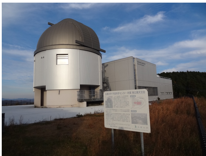
広島大学宇宙科学センター東広島天文台